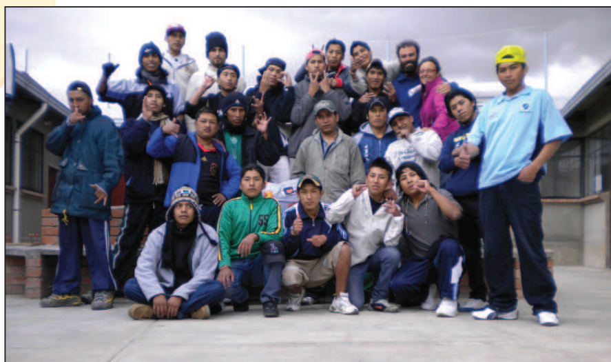
I ragazzi del centro Qalauma