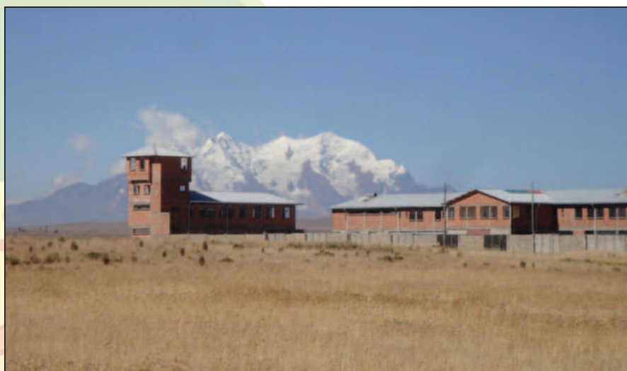
Il centro Qalauma di El Alto

In una successiva fase del loro processo educativo le ragazze potranno anche interagire con i ragazzi del centro in differenti attività come lo sport, la cucina, la scuola, i laboratori.